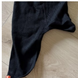
Foto 2. Kiivrisuka näoava